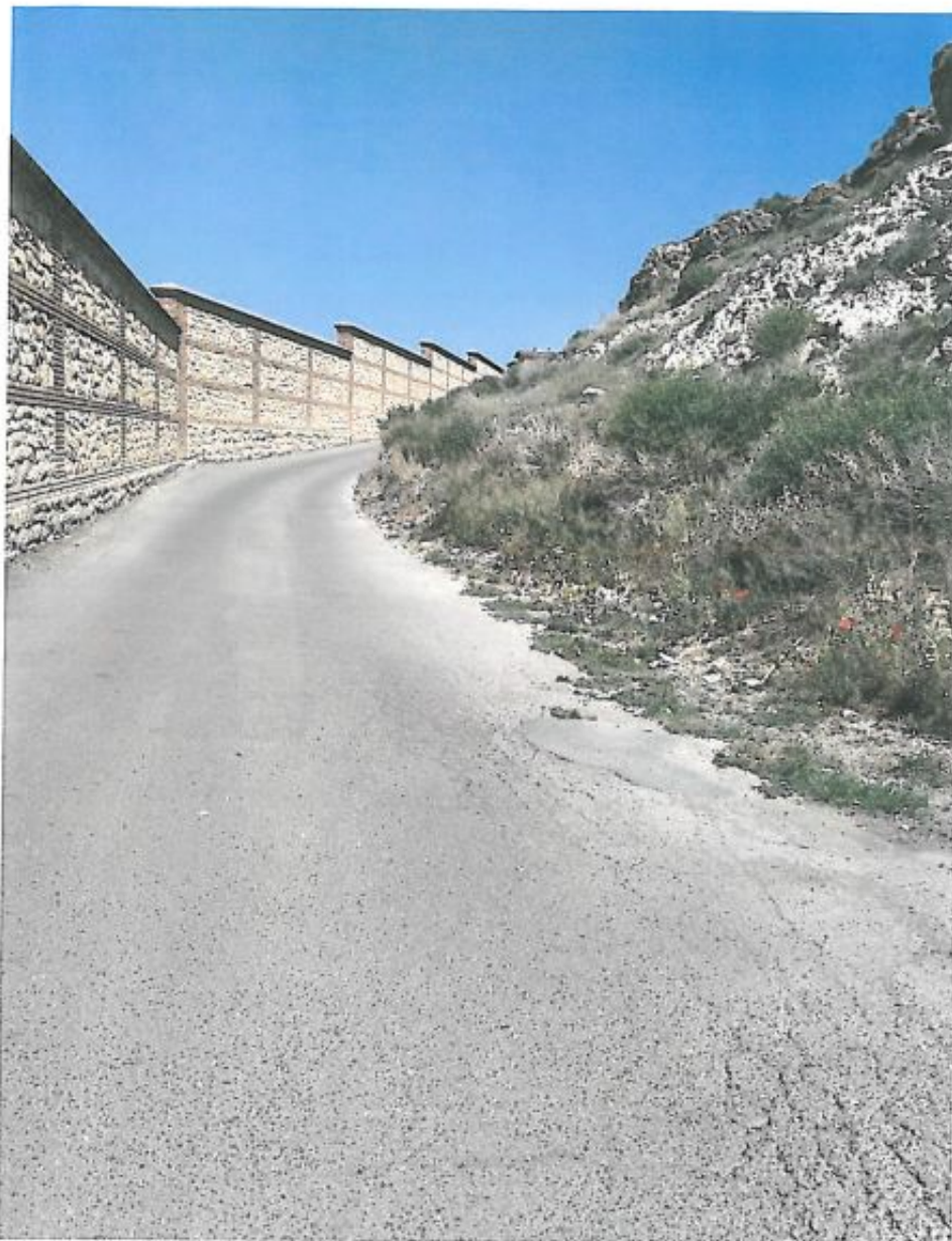
③ ARRREGLO Y ALUMBRADO CAMINO CAPUCHINOS.