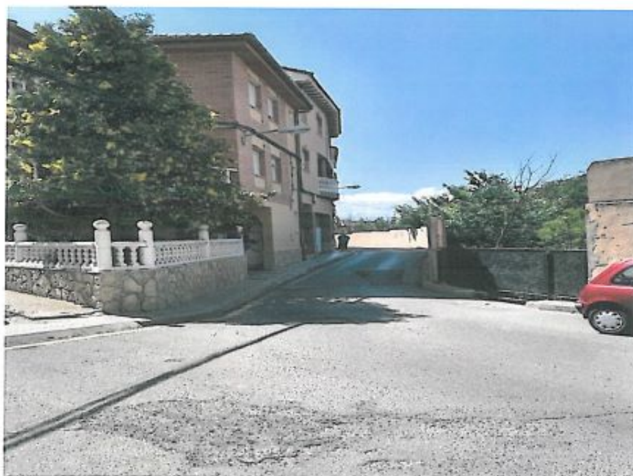
① ENSANCHAMIENTO CIBARRIO DEL CARMEN (PRIMER TRAMO)